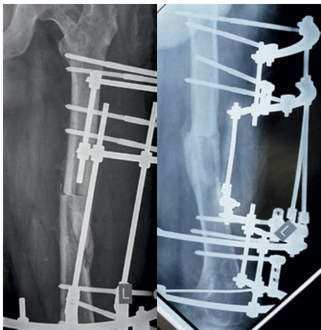
Рис. 10. Остеосинтез аппаратом внешней фиксации левой бедренной кости.

Анализ клинических данных также показал, что одним из часто применяемых способов лечения инфицированных ложных суставов бедренной кости, является методика необоснованной замены одного погружного фиксатора на другой, т.е. пластины на штифт или наоборот, в сочетании с различными способами костной пластики, применяемыми с целью замещения дефекта и стимуляции процессов остеогенеза [2, 4]. Такая тактика не только вызывает нарушение периостального и эндостального кровообращения в очаге, но и способствует дополни-