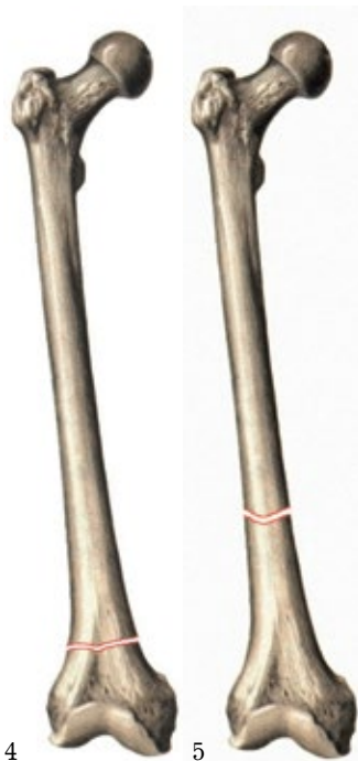
Рис. 4. Однорычаговый перелом. Fig. 4. Single lever fracture. Рис. 5. Двухрычаговый перелом. Fig. 5. Two-lever fracture.

ние). При этом дренажные трубки размещали в каждой полости между мышцами и под апоневрозом. Рану ушивали. Аппарат стабилизировали. Накладывали асептические повязки на рану и вокруг стержней и спиц.