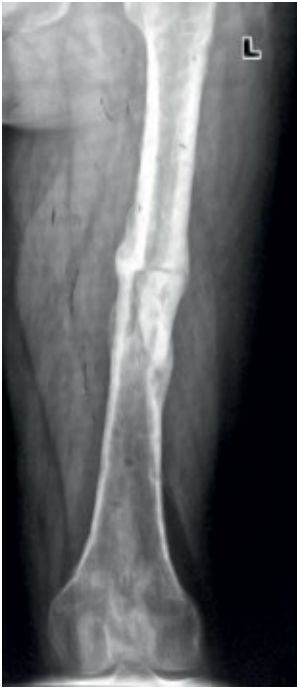
Рис. 11. Сросшийся ложный сустав среднего отдела левой бедренной кости.

Fig. 11. The accrete pseudoarthrosis of the middle section of the left fem.