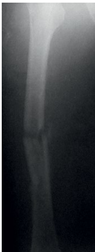
Рис. 9. Ложный сустав средней трети левой бедренной кости. Состояние после удаления штифта.

Fig. 9. Pseudarthrosis of the middle third of the left femur. Status after removing the pin.