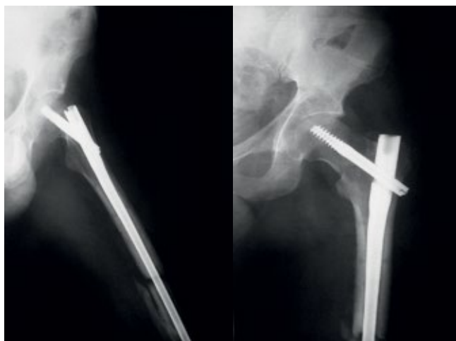
Рис. 8. Первичный остеосинтез левой бедренной кости интрамедуллярным штифтом с блокированием.

Через 6 мес с момента травмы с жалобами на боли в области левого бедра в средней трети и коленном суставе госпитализирован в ФГБУ «НМИЦ ТО им. Н.Н. Приорова» МЗ РФ. Диагностирован ложный сустав левой бедренной кости, осложненный хроническим остеомиелитом (рис. 9).